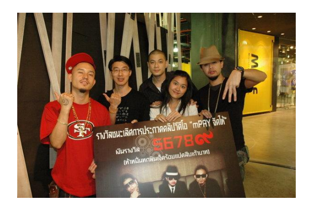
✓ Winner of the Competition to Produce a Music Video Clip for Thaitanium and mPay in 2009