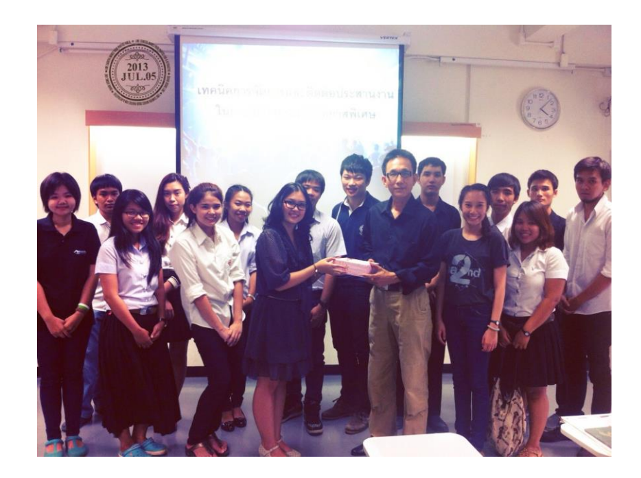
✓ Special Lecturer in Subject of Special Event Production for Bachelor Degree Students in Faculty of Mass Communication, Chiang Mai University in 2013-Present