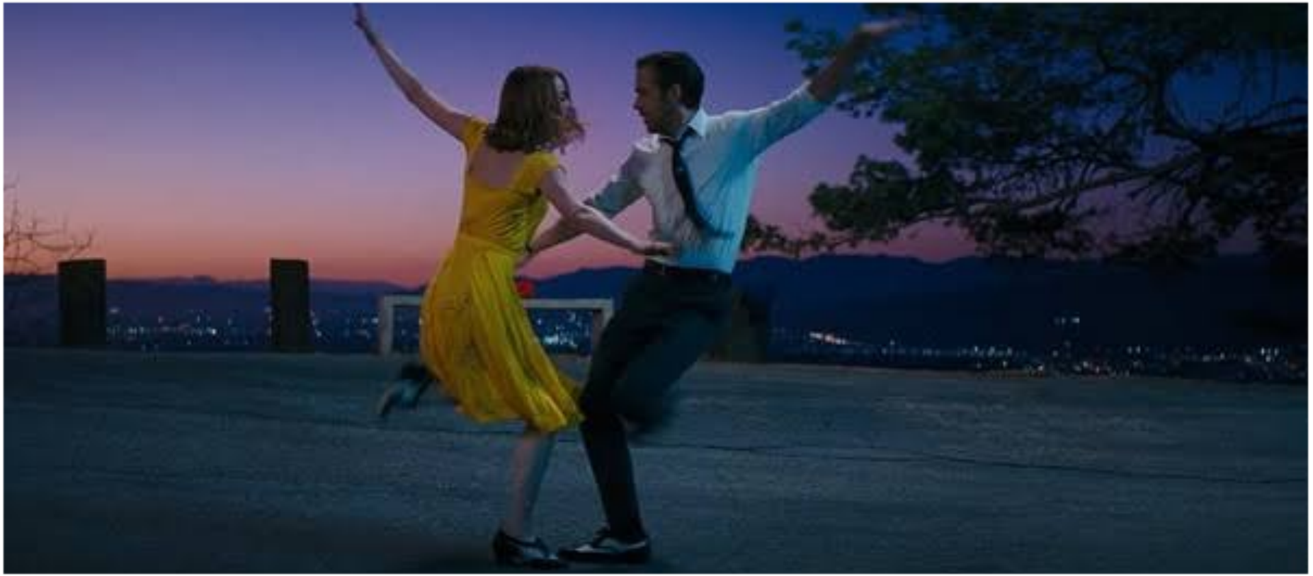
la la land, 2016

ตัวอย่างของการทำลายความ กลมกลืน เช่นการใช้คู่สีตรงข้าม