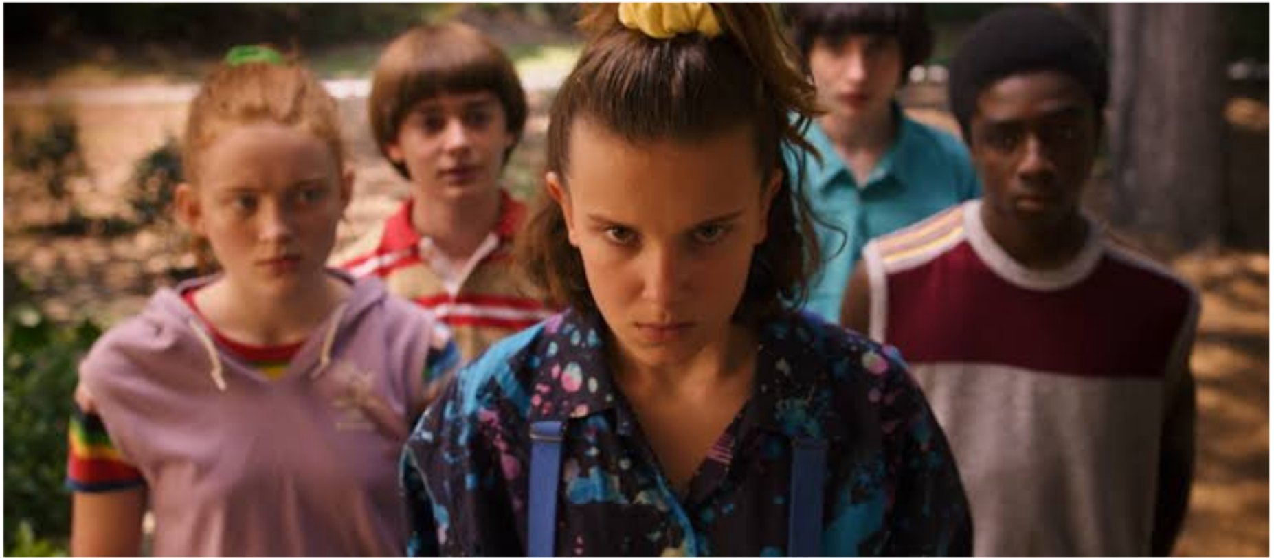
The Stranger Things, 2016-present

หากผู้แสดงเคลื่อนที่ไปตำแหน่งอื่น ต่อหรือพบกับ กลุ่มคนที่มีเครื่อง แต่งกายสีสันท่างๆกัน จำเป็นต้อง พิจารณาว่าเครื่องแต่งกายดังกล่าว ยังเหมาะสม กลมกลืนอยู่หรือไม่