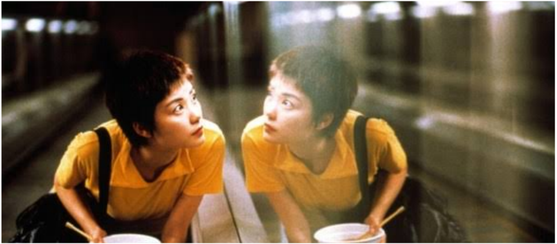
Chungking Express, 1994

เมื่อผู้แสดงเคลื่อนไหวหรือเดินทางไป ยัง ตำแหน่งต่างๆ ในฉาก สีของเครื่อง แต่งกาย และสีของฉาก (ผนัง วอลเปเปอร์ โซฟา เก้าอี้ ฯลฯ) ควรอยู่ใน ในเกณฑ์ที่เป็นสีกลมกลืน หรือ เข้ากัน