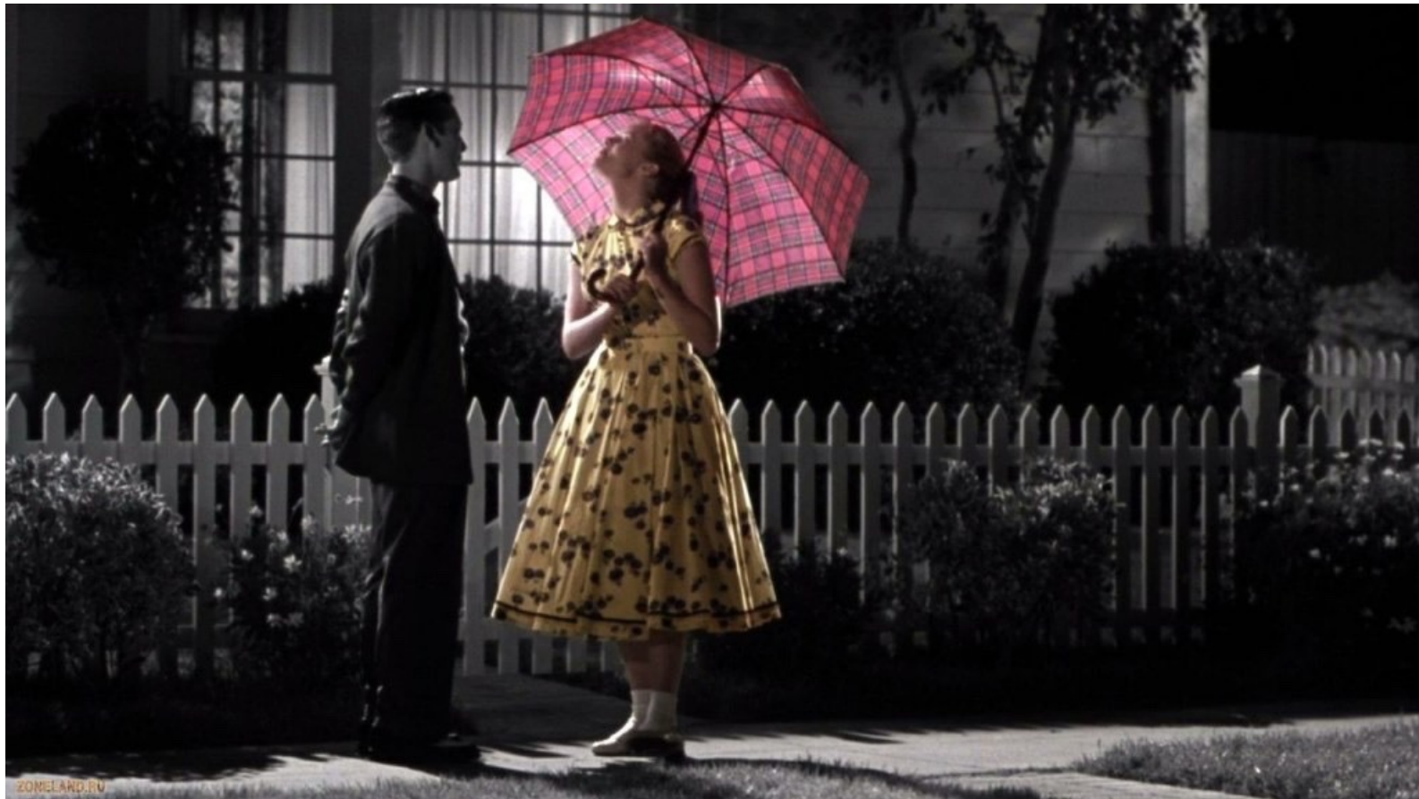
Pleasantville, Gary Ross, 1998

การเปลี่ยนสีอย่างน่าทึ่งและสีที่เหนือจริงสามารถดึงดูดความสนใจและมอบประสบการณ์ที่รวดเร็วยิ่งขึ้น