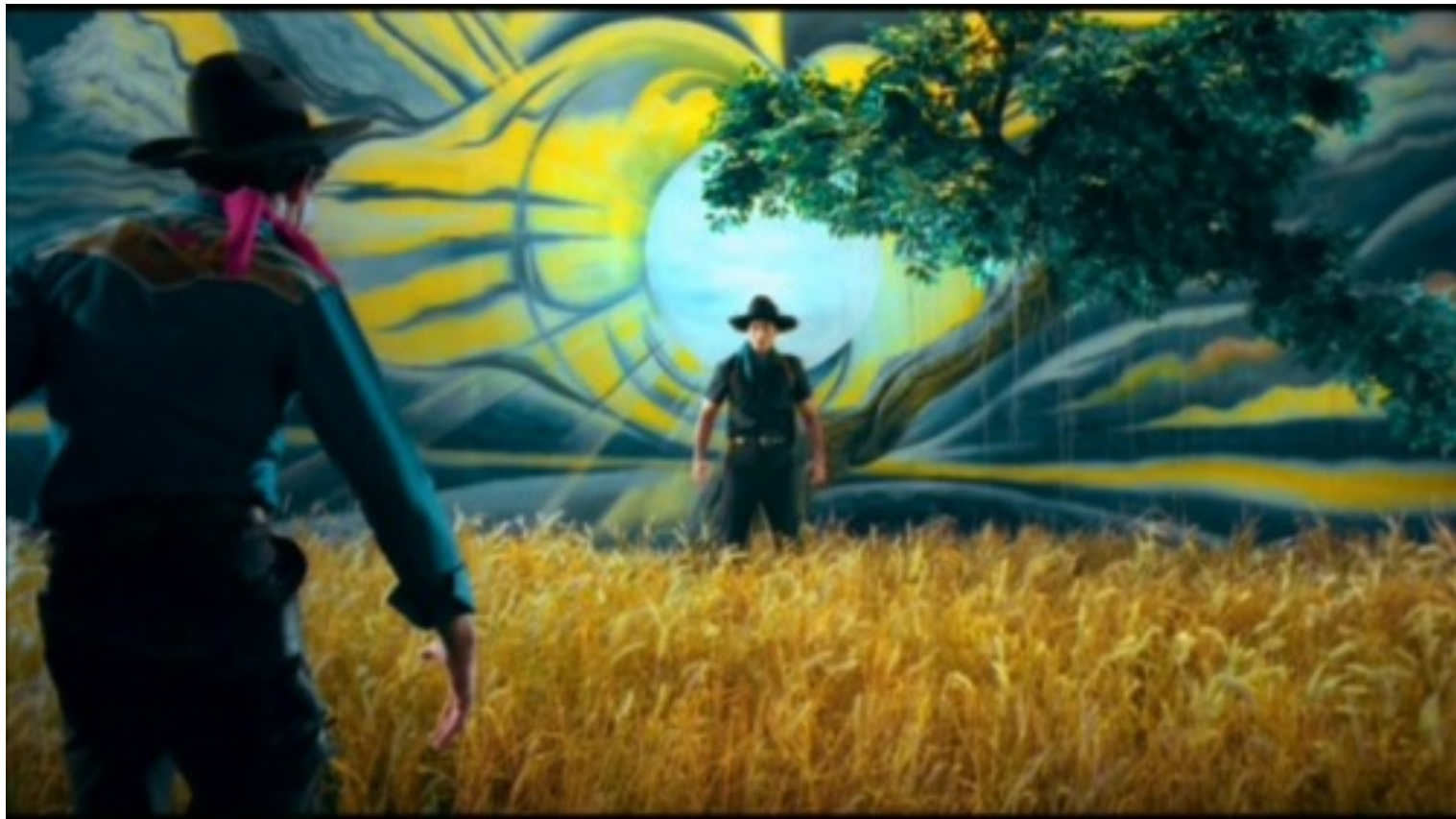
Tears of the Black Tiger, 2000

สีสามารถนำมาใช้เป็นเครื่องมือได้อย่างเรียบง่าย ในขั้นพื้นฐานคือการเลียนแบบแสงและความรู้สึกของความเป็นจริง และวิธีการที่ซับซ้อนคือการสร้างอารมณ์ที่เหนือจริงดูจภาพฝัน