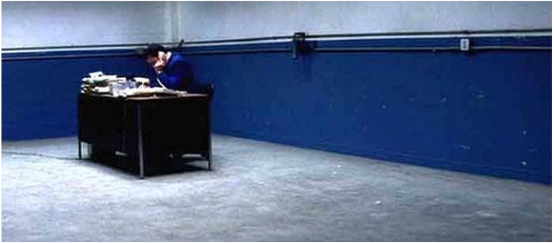
Punch Drunk Love, 2002

(6) ความหมายเชิงลึกและแง่มุม ทางจิตวิทยา