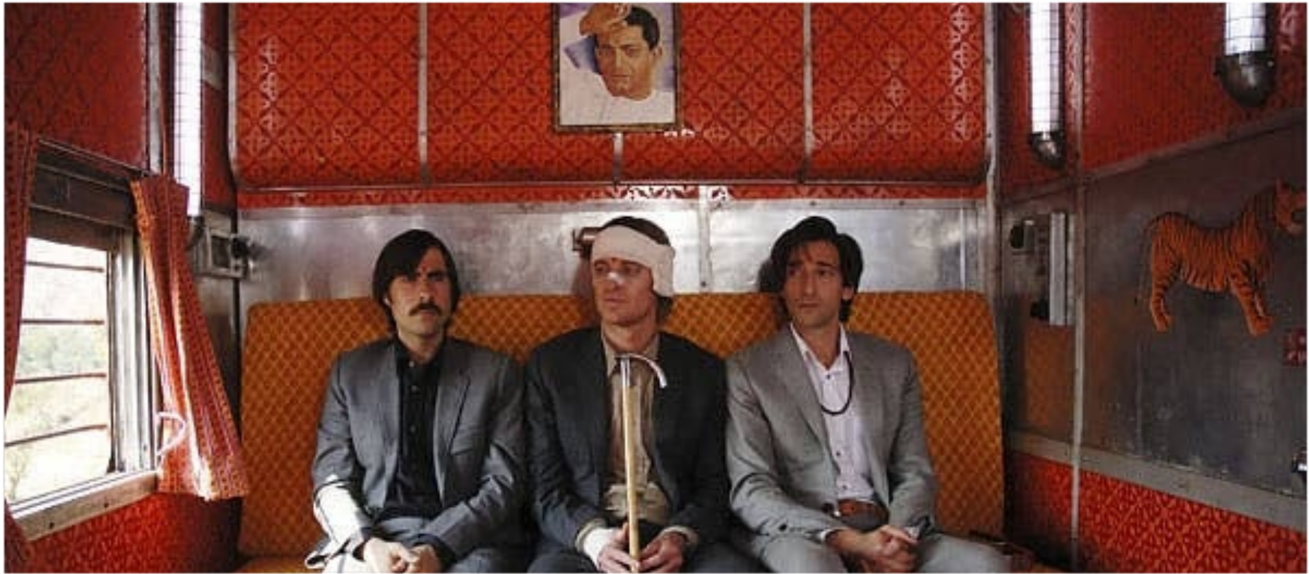
The Dajearing Limited, 2007

(5) บุคลิก ลักษณะตัวละคร เป็นคนมองโลกในแง่ดี แกร่งร้าย อ่อนไหว ตื้อดิ่ง เสียดลี ประชด ประชัน ทั่นสม้ย