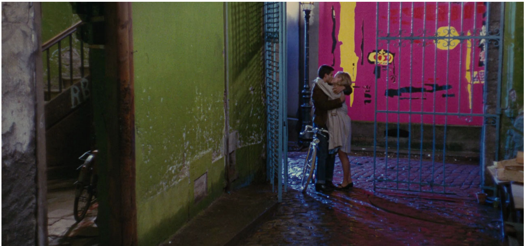
The Umbrellas of Cherbourg (1964)

..... การใช้สีต้องมาจากความเข้าใจที่สมบูรณ์ของเรื่องราวและวิธีการบอกเล่า สีสามารถให้รูปลักษณะที่สมจริงหรือไม่จริงขึ้นอยู่กับรูปแบบของการเล่าเรื่อง