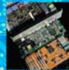
PCBA Printed Circuit Board Assembly